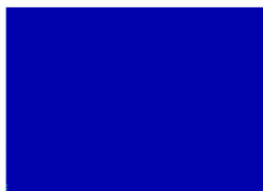
PANTONE REFLEX BLUE